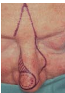
LAMBEAU DE RIEGER-MARCHAC

Chirurgiens cervico-faciaux Hôpital Privé Drôme Ardèche