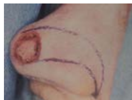
LAMBEAU DE RIBKA